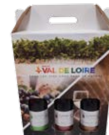
COFFRET VALISETTE 3 BOUTEILLES